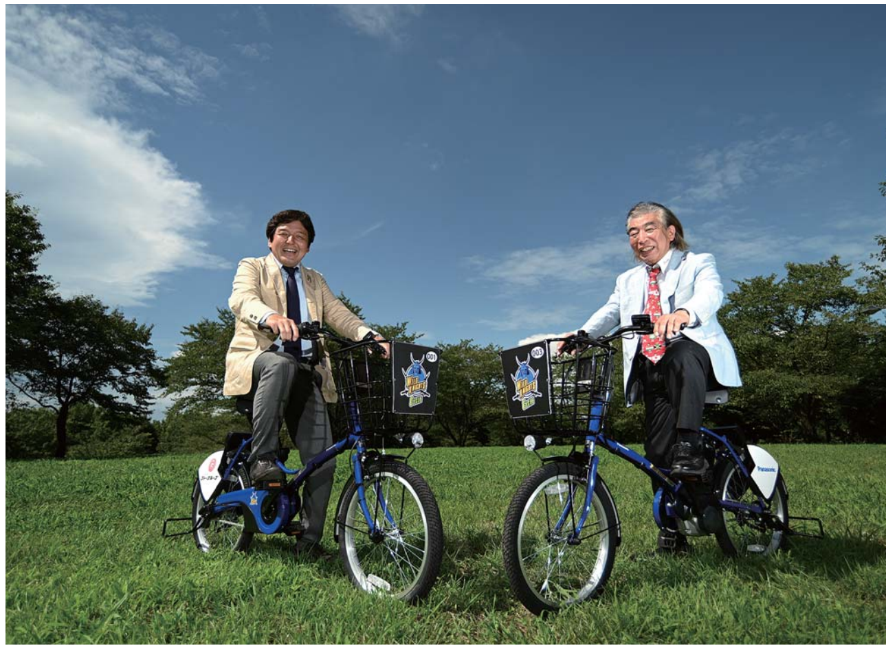
シェアサイクルに使われる電動アシスト自転車。ワイルドナイツのイメージカラー「Panasonicブルー」の特注品

ワイルドナイツは社会資本。自転車で脱炭素へ 後藤 物と一緒に事業をつくれるというモデルにしてほしいと思っています。健康づくりや脱炭素社会への取り組みを進めていこうと、自転車の活用が注目されています。ゴトーグループでは、これまでにも自転車を活用した取り組みを多く行ってきました。今回、ワイルドナイツと協力して、環境問題への取り組みを進めていこうと、自転車の活用が注目されています。ゴトーグループでは、これまでにも自転車を活用した取り組みを多く行ってきました。今回、ワイルドナイツと協力して、環境問題への取り組みを進めていこうと、自転車の活用が注目されています。